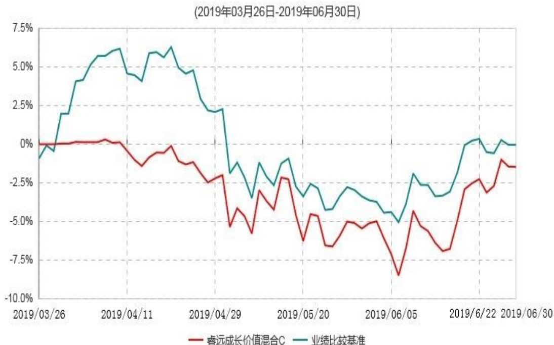
睿远成长价值混合C累计净值增长率与业绩比较基准收益率历史走势对比图

注：本基金合同生效之日为2019年3月26日，截至本报告期末，基金成立未满半年；本基金建仓期为本基金合同生效之日（2019年3月26日）起6个月。